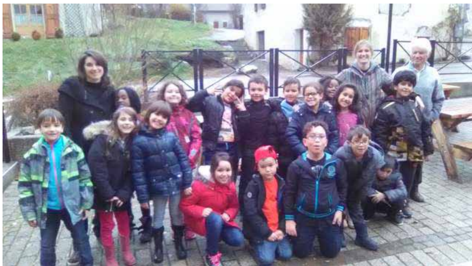
Groupe A du stage Théâtre et Mouvement - CCAS St Andéol

Le Théâtre d'Anoukis se retrouve autour d'une volonté forte : celle de ne pas séparer le culturel du socio-culturel. Un travail de création va de pair avec un travail de médiation. L'un n'est pas le parent pauvre de l'autre, il en est son alter ego, son déploiement.